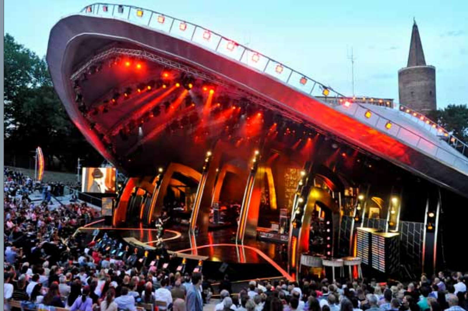
Amphitheater in Oppeln

Karten auch erhältlich bei: Schlesische Schatztruhe, Brüderstr. 13, 02826 Görlitz, Tel. 03581/410956 auch sonntags von 10 bis 17 Uhr geöffnet!