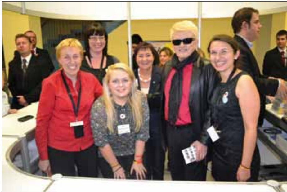
Heino in der Breslauer Jahrhunderthalle im Jahr 2012