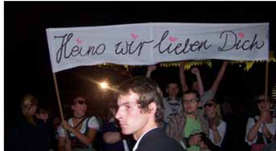
Heino-Fans 2012 in Breslau

Sicher kann ich mir das vorstellen. Das sind sehr schöne und interessante Städte und Re-